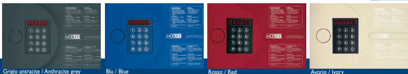
Grigio antracite / Anthracite grey

The doors of electronic versions can be supplied in any of the four colours, in order to blend with the furnishings. If not specified with order, the basic colour will be anthracite grey.