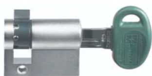
Nelle foto è rappresentato un cilindro Champions® Mottura The cylinder shown is a Mottura Champions®

Le versioni HM... sono fornite con una chiave maestra che apre tutti i cilindri delle casseforti appartenenti allo stesso gruppo.