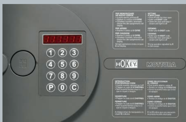
Versione neutra/Basic version

Electronic safes can be customized on the door, by printing the logo of hotel, resort, ship; please contact the company for further informations.